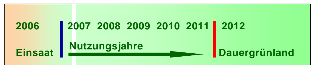
Abb. 3: Beispiel zur Definition von Dauergrünland